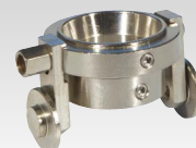
液轮支架 用于TPT 40焊枪 040199