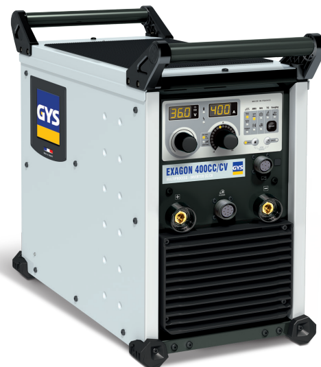
Dodávan bez příslušenství