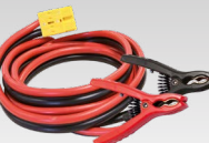
2 x 8 m - 16 mm 2 056572