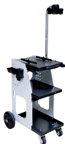
ref. 051331 + 052284 UNIVERSAL 800 + Fritbærende arm