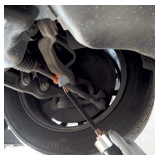
Løsning af styretøjsledforbindelser