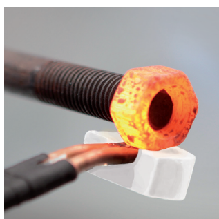
Løsning af frosne bolte