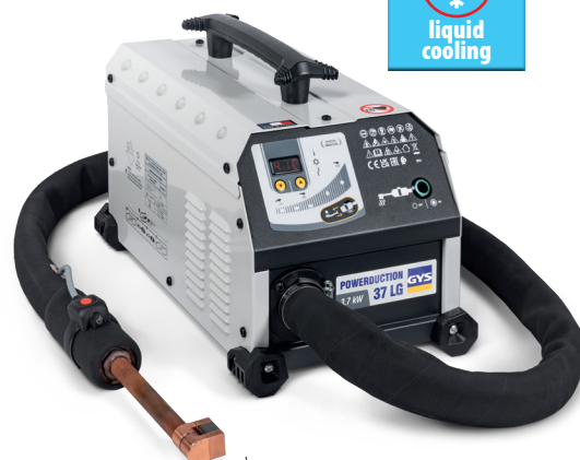
Udstyret med en komplet induktor 90°