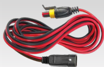
Verlängerungskabel 2,5 m - 029057