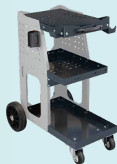
SPOT 800 Fahrwagen Art-Nr. 051331