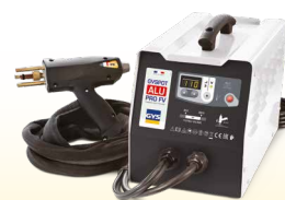
PROLINER ALU PRO FV - Art-Nr. 035836