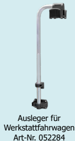
Ausleger für Werkstattfahrwagen Art-Nr. 052284