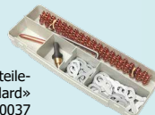
Stahl Zubehör-/Verschleißteile- Box «Standard» Art-Nr. 050037