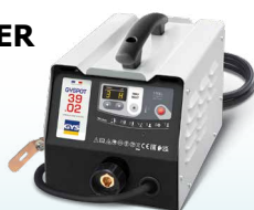
PROLINER 39.02 - Art-Nr. 035775 PROLINER 39.04 - Art-Nr. 035782