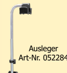
Ausleger Art-Nr. 052284