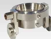
Καρτσάκι για φακό TPT 40 040199