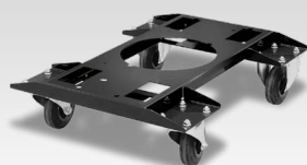
Καροτσάκι για τροφοδότη καλωδίων WS 040977