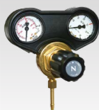
Ρυθμιστής 30L/min 041622 041219 041646