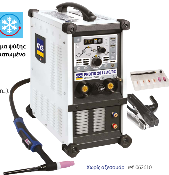
Χωρίς αξεσουάρ : ref. 062610