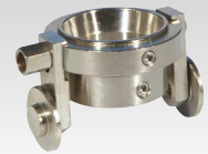
Carro para antorcha TPT 40 040199