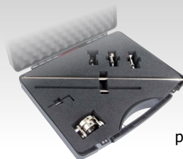
Kit compas para antorcha TPT 40 040205