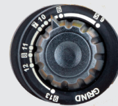
Tinte 5>13 y modo pulido