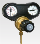
Regulaator 30L/min 041622 041219 041646