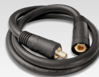
Polaarsuse ümberpööramise kaabel 033689