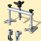
Alu Puller ref. 051003