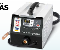
PROLINER 39.02 - ref. 035775 PROLINER 39.04 - ref. 035782