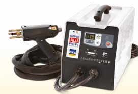
PROLINER ALU PRO FV - viite. 035836