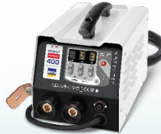
PROLINER PRO 230 - ref. 035799 PROLINER PRO 400 - ref. 035805