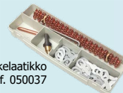
Teräksinen tarvikelaatikko ref. 050037