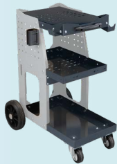
Spot 800 -vaunu ref. 051331