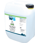
ref. 062511 Liquide de refroidissement spécial soudage - 5 l