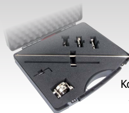
Komplet kompas za Torch TPT 40 040205