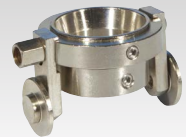
Kolica za Torch TPT 40 040199