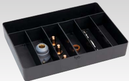
Kutija za potrošni materijal za Torch TPT 40 45 A - 039957