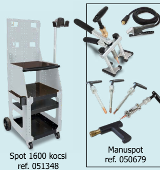
Spot 1600 kocsí ref. 051348