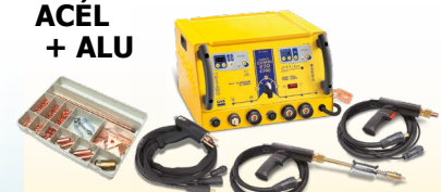
SPEEDLINER Combi 230 E PRO - ref. 036062