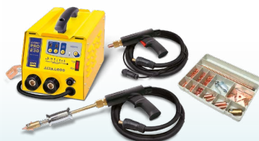
SPEEDLINER PRO 230 - ref. 036017 SPEEDLINER PRO 400 - ref. 036024