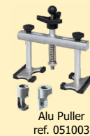
Alu Puller ref. 051003