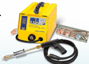
SPEEDLINER 39.02 - ref. 035010 SPEEDLINER 39.04 - ref. 035027