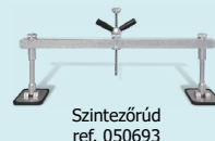
Szintezőrúd ref. 050693