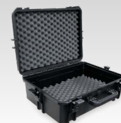
Helyszíni tok IP67 060432