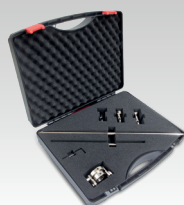
Carrello PLASMA 600 040298