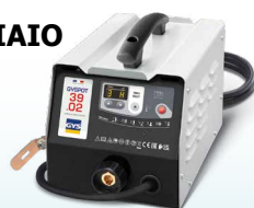
PROLINER 39.02 - ref. 035775 PROLINER 39.04 - ref. 035782