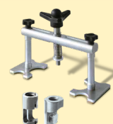
Alu Puller (per alluminio) ref. 051003