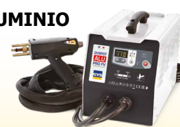
PROLINER ALU PRO FV - ref. 035836