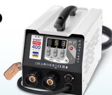
PROLINER PRO 230 - ref. 035799 PROLINER PRO 400 - ref. 035805