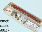
Confezione complementi riparazione ammaccature acciaio ref. 050037