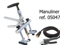
Manuliner ref. 050471