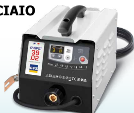
EASYLINER 39.02 - ref. 053618