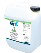
ref. 082212 Liquido di raffreddamento speciale saldatura - 2 l