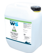
ref. 062511 Liquido di raffreddamento speciale saldatura - 5 l