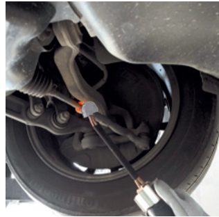
ステアリング解除