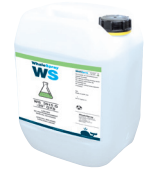
商品番号, 062511 クーラント特殊溶接 - 5 l