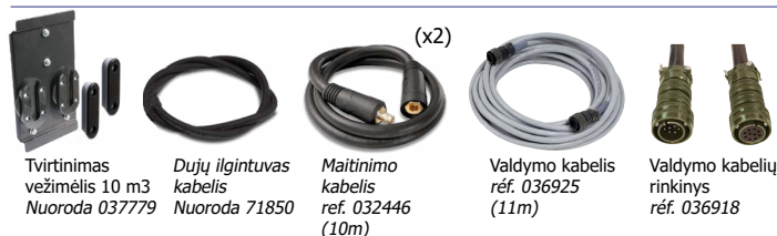
Tvirtinimo vežimėlis 10 m3 Nuoroda 037779