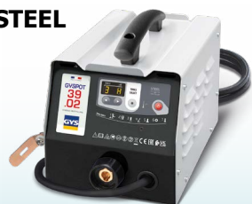
EASYLINER 39.02 - nuoroda. 053618