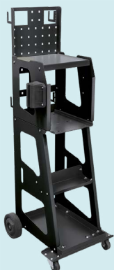
Spot 1000 vežimėlis nuoroda. 053540