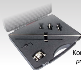
Kompasa komplekts priekš Torch TPT 40 040205