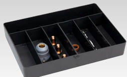
Palīgmateriālu kaste, kas paredzēta lāpīstai TPT 40 45 A - 039957