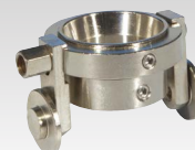
Ratiņi lukturītim TPT 40 040199