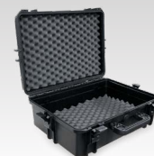
Uz vietas uzstādāms korpuss IP67 060432