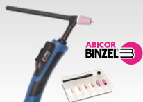
SR26DB - 4 m 038271