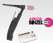
SR26L - 8 m 046184