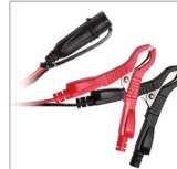
Klemmen (45 cm)