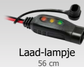
Laad-lampje 56 cm