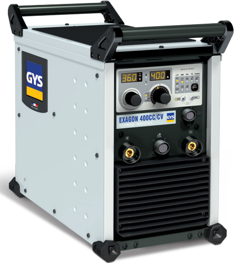
Entregue sem acessórios