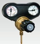
Manómetro 30L/min 🇫🇷 041622 🇩🇪 041219 🇬🇧 🇫🇷 041646