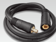
Cabo de comutação de polaridade 033689