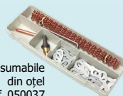
Cutie de consumabile din oțel ref. 050037