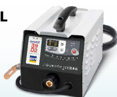
PROLINER 39.02 - ref. 035775 PROLINER 39.04 - ref. 035782