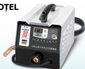
EASYLINER 39.02 - ref. 053618