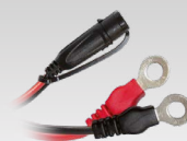
Коннектор для наконечника 45 см - M6 029194