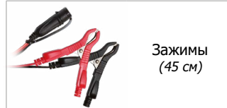
Зажимы (45 см)