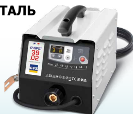
EASYLINER 39.02 - Арт. 053618