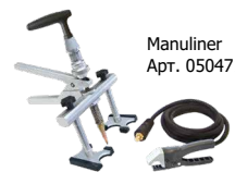
Manuliner Арт. 050471