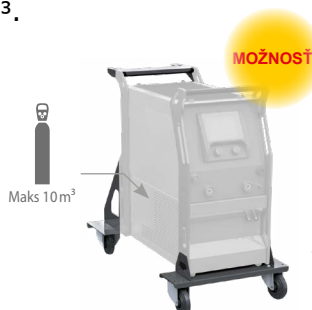
Vozík ref. 040960

Jednoduchý režim alebo režim PRO s prístupom ku každému parametru.