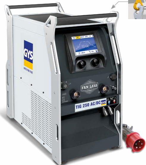
Dodáva sa bez príslušenstva