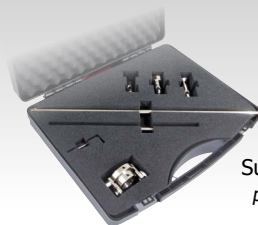
Súprava kompasu pre horák TPT 40 040205