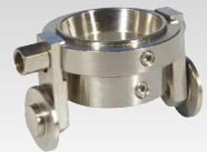
Vozík pre horák TPT 40 040199