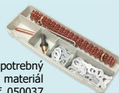
Oceľový box na spotrebný materiál ref. 050037