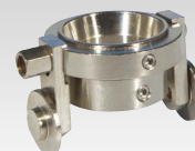
Voziček za gorilnik TPT 40 040199