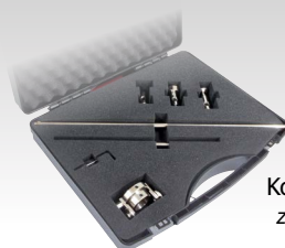
Komplet kompara za gorilnik TPT 40 040205