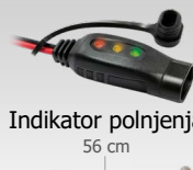
Indikator polnjenja 56 cm