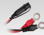
Priključek z ušescem 45 cm - M6 029194