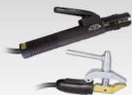
MMA kit 500A - 4 m - 50 mm 2 047419