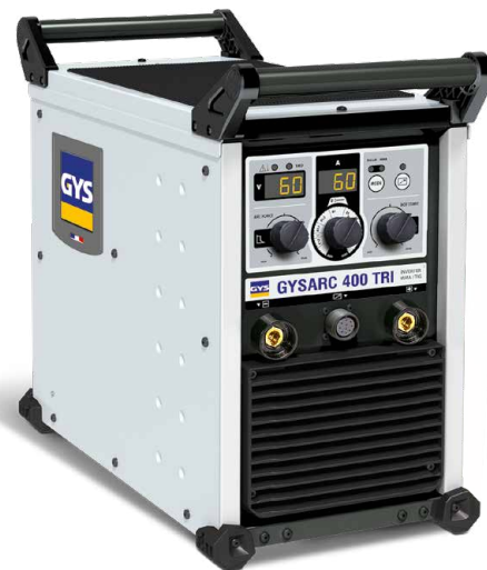
Levereras utan tillbehör