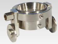
Vagn för Torch TPT 40 040199