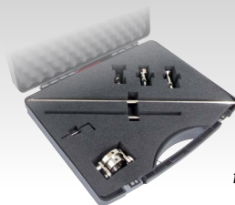
Kompasssats för Torch TPT 40 040205