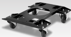
Візок для механізму подачі дроту WS 040977