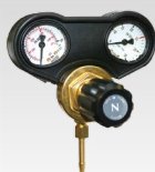
Регулятор 30 л/хв 041622 041219 041646