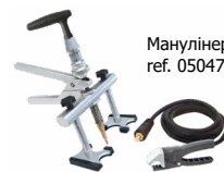
Манулінер ref. 050471