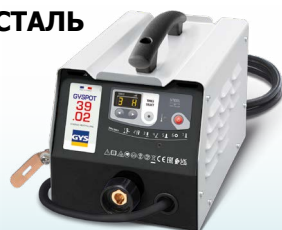
EASYLINER 39.02 - арт. 053618