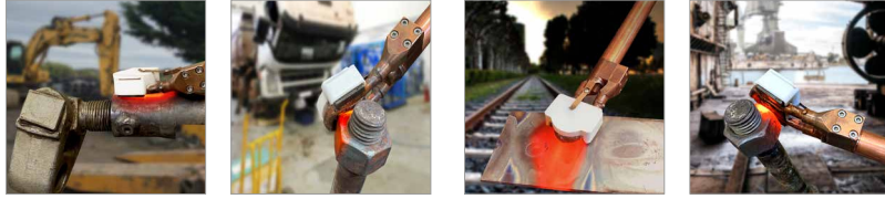
Cơ khí & bảo dưỡng ô tô, xe tải & ngành xây dựng