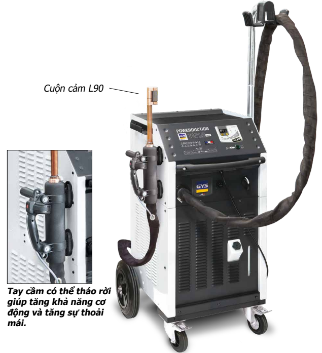
Cuộn cảm L90

POWERDUCTION 110LG có chế độ quản lý thời gian tỏa nhiệt và có thể được kiểm soát bằng bộ điều khiển nhiệt độ thông minh (Tùy chọn:: Powerduction Heat Controller (Bộ điều khiển nhiệt cho máy gia nhiệt cục bộ) - mã số. 061644). Công nghệ này cần thiết để kiểm soát quá trình gia nhiệt giúp thu được kết quả như yêu cầu.