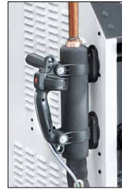
Tay cầm có thể tháo rời giúp tăng khả năng cơ động và tăng sự thoải mái.