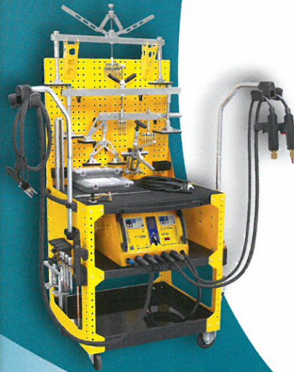
AUSBEULSPOTTER MOBILE STATIONEN große Modellvielfalt ab € 885,- Aktionspreis