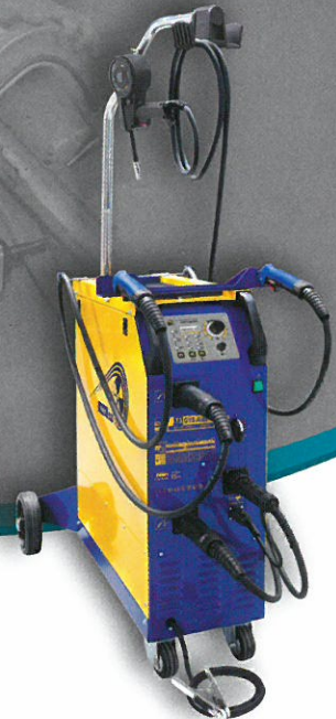
MIG/MAG LÖT- UND SCHWEISSMASCHINEN große Modellvielfalt ab € 1.150,- Aktionspreis