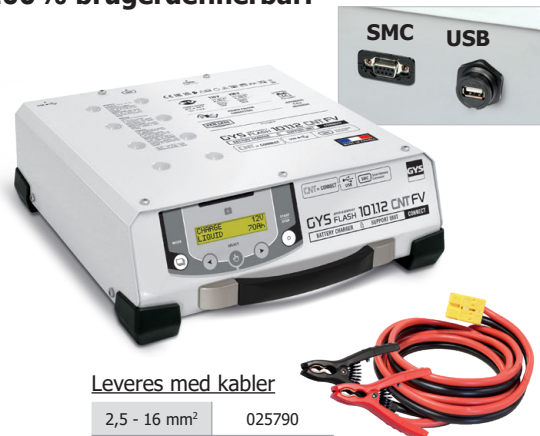
Leveres med kabler