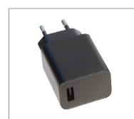
12 V oplader