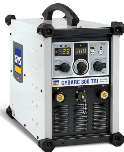
Leveres uden tilbehør