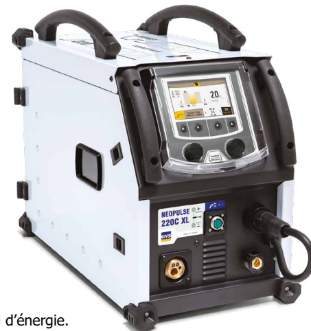
Livré sans accessoires