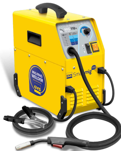
Livré avec câble de masse et torche fixe 2,2m.

GÁZ NÉLKÜLI hegesztés külterületre is. 0,9 átmérőjű porbeles hegesztőhuzal. (kit no gaz : 041240)