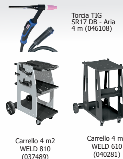
Carrello 4 m2 WELD 810 (037489)